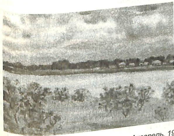
Г. Травников. На родине А. Еранцева. Акварель, 1973 г.

Он до последних дней надеялся на ту “теплинку”, что в душе осталась. Она должна уйти на то, “чтоб сердце завести”.