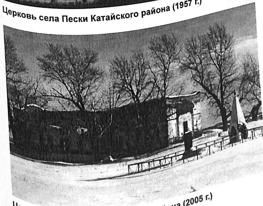
Церковь села Пески Катайского района (2005 г.)