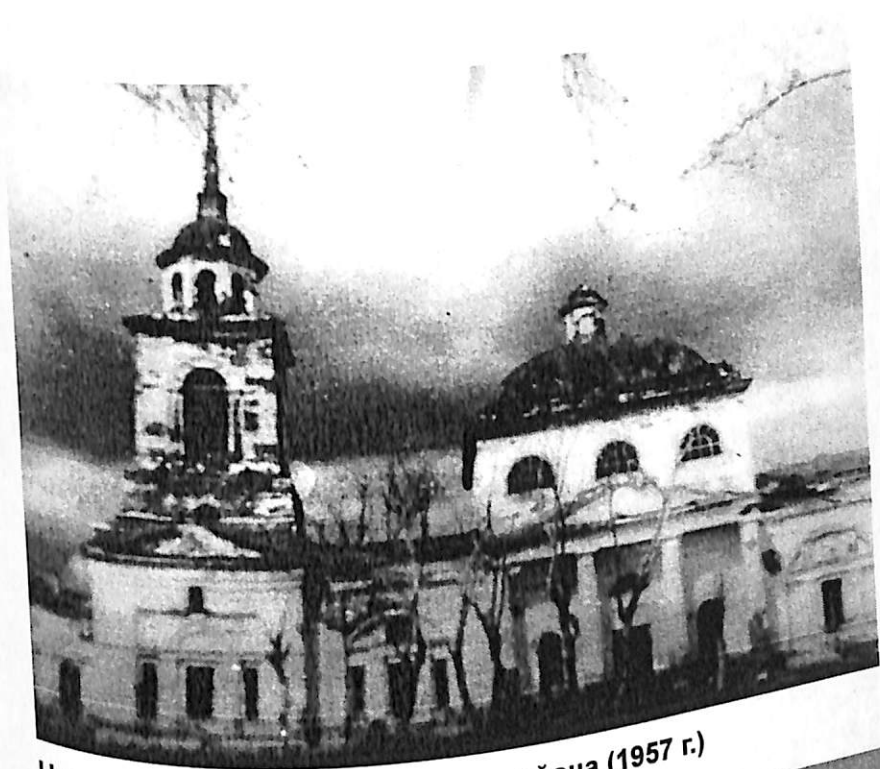
Церковь села Пески Катайского района (1957 г.)

Заступить за столы губовы, За скатерти браны, За яствы сахарны, За питья медвяны, Сесть на брусчату лавицу, На пол чеканен И на ткани шелковы, Под святыя иконы И под свечи воску ярого. Где ведется княже место, Тут Господь Бог благословит.