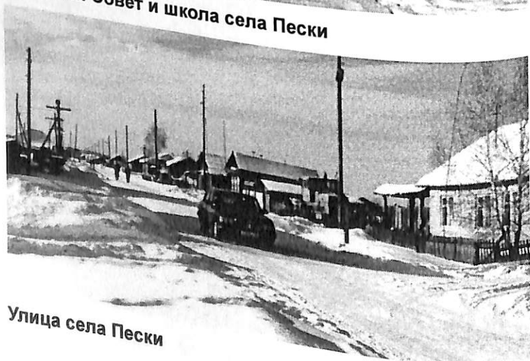
Улица села Пески