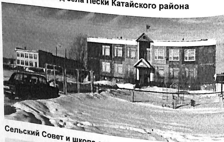
Сельский Совет и школа села Пески