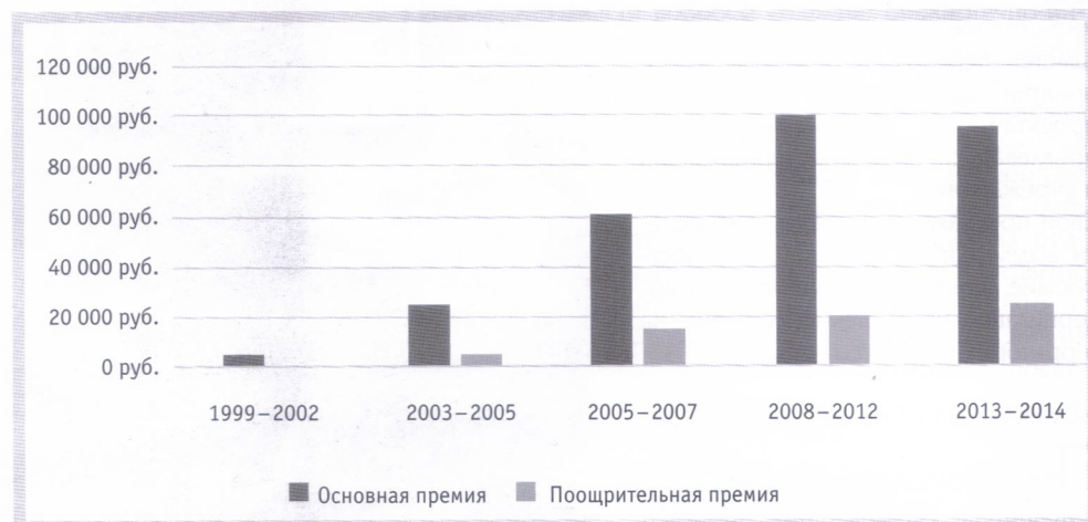
Динамика размера премий

Проект «Курган читает. А ты?», разработанный в партнёрстве с ОО «Ассоциация библиотекарей г. Кургана», стал ключевым событием Года литературы в регионе. Этот проект победил в открытом конкурсе на грант главы города (заявка от ОО «Ассоциация библиотекарей г. Кургана») и областном конкурсе социально-инновационных проектов «Библиотека XXI в.» (заявка в номинации «Территория чтения» от ЦДБ им. Н. Островского). Данный проект был ярким, объединяющим горожан событием. Социальная реклама,