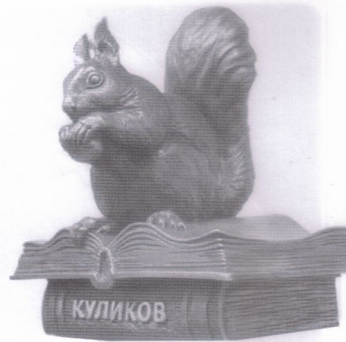
Литературный бренд Кургана

Участвуя в конкурсах, библиотеки получают и подарки: Целинная МЦБ награждена ценным подарком – ламинатором по цене 3400 руб. за призовое место в патриотическом марафоне «Имя земляка» на сайте «Память Зауралья». В Шумихинской ЦРБ благодаря участию в област-