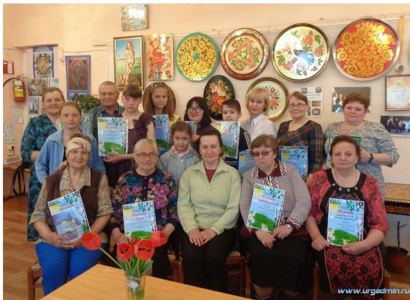
«Есть край красивый – Зауралье»

В массовых мероприятиях ЦБ нашли отражение: 100-летний юбилей ВЛКСМ ( встреча поколений «Комсомол, ты в памяти моей...» ); на 9 мая была оформлена Стена Памяти в здании КДО, выставлены альбомы для просмотра «Они сражались за Родину», «Ветераны В. О. В. и вдовы»; проведена акция «Ветеран живет рядом» .