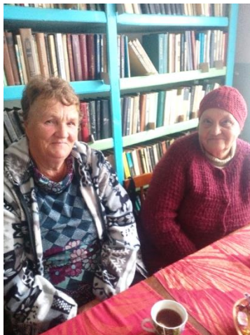
День пожилого человека

В библиотеках созданы и работают клубы для пожилых людей и людей с ограниченными возможностями здоровья : досуговое направление – «В кругу друзей», «Хозяюшка», «Мир женщины», «Чаровницы», «Клуб интересных встреч», «Здравушки»; ДПИ: «Волшебная нить», «Суперстар», «Рукодельница», «Кудесница»; познавательно-досуговое – «Литературная гостиная», «Оптимисты», «От всей души»; шахматный клуб «Белая ладья».