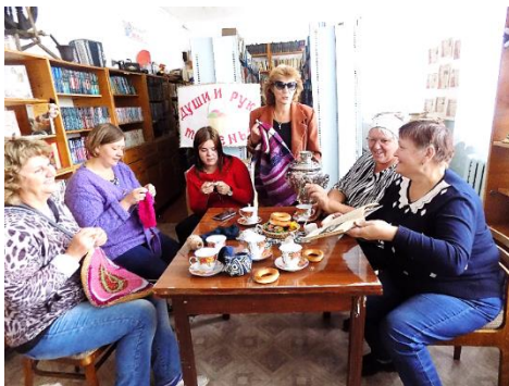
Посиделки «Волшебный клубок»

и отцах, память о которых бережно хранится в семье на старых фотографиях; о матерях – труженицах тыла (ЦБ).