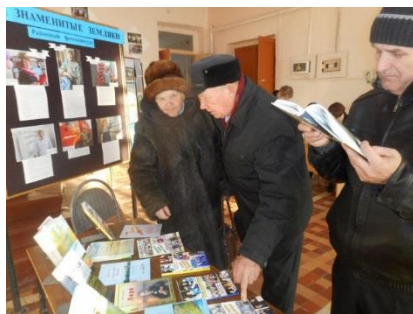
ЦБ. Юбилей района – 95 лет

К 95-летию Шатровского района центральной библиотекой объявлена декада краеведения «Мой край – Шатровская земля» . Литературно-музыкальные вечера «Зауралье, мое, Зауралье», «Живи, процветай земля родная!», «Этот край мне подарен судьбой», «Есть земля, на которой живу я» состоялись в сельских библиотеках района. Сотрудники