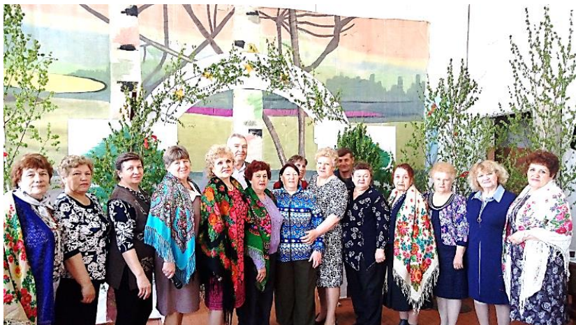
Посиделки на Троицу (Птичанская СБ)

программу с конкурсами, поздравлениями, стихами и песнями (Столбовская СБ).