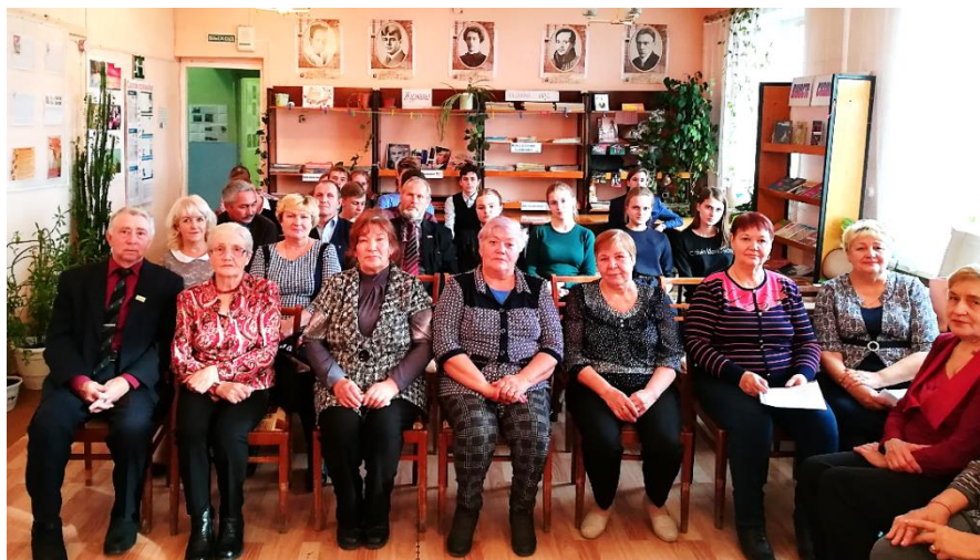
Встреча поколений «Комсомол, ты в памяти моей...»

В МКУ «Юргамышская МЦБ» осуществлены проекты и программы: «Годы золотые: библиотека – старшему поколению» (ЦБ), «Сети все возрасты покорны» (ЦБ), «Копилка здоровья» (ЦБ).