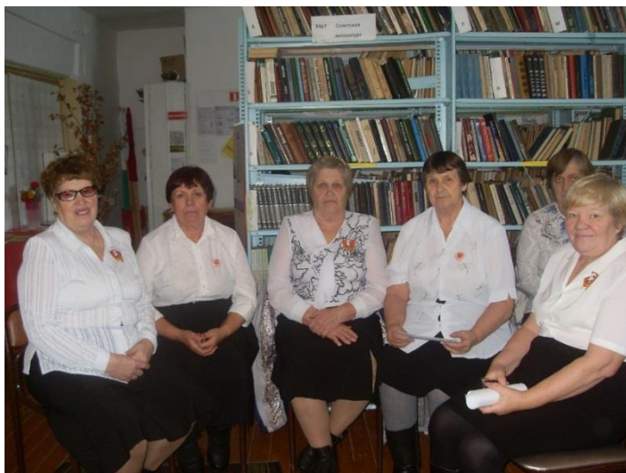
Агитбригада серебряного возраста

В сельских библиотеках района работают клубы для пенсионеров: «Мудрость» (информация, досуг, огород); «Надежда» (краеведение, досуг, рукоделие); «Сельчаночка» (универсальный).