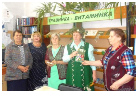
Клуб «Сударушка». Час здоровья «В гостях у травницы»