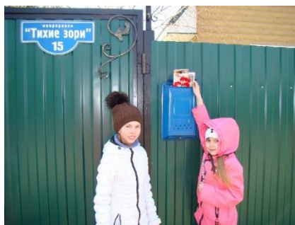
Поздравление ветеранов и тружеников тыла