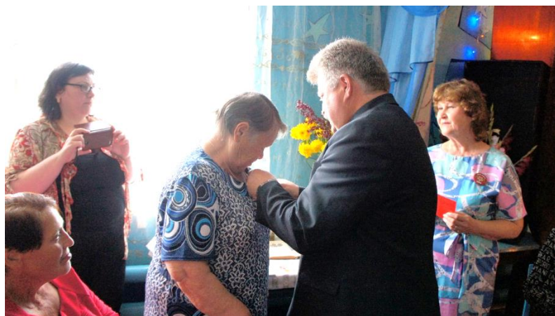
Торжественное мероприятие «Снова ожили в памяти были живые. Дети войны»