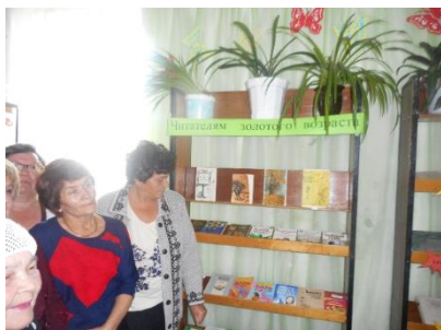
Клуб «Ветеран». Презентация выставки «Читателям золотого возраста»