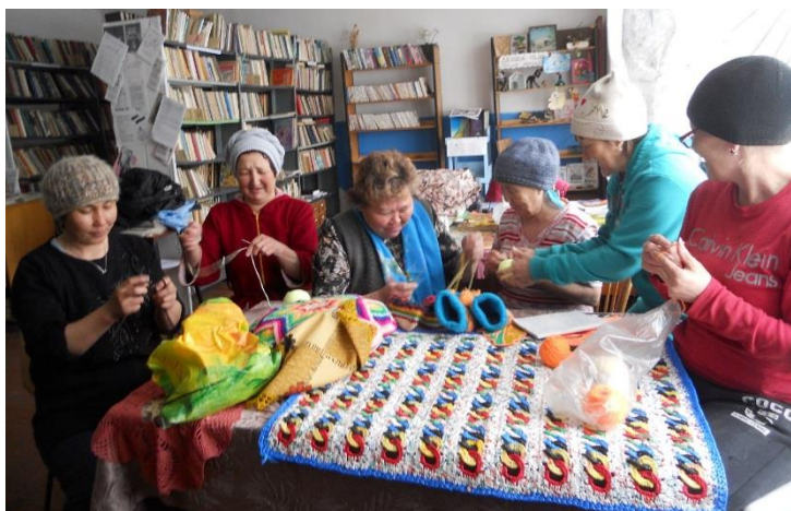
Занятие кружка «Вязание» (Лебедевский библиотечный пункт)

Для организации досуга пожилых пользователей при библиотеках функционируют клубы: «Встреча» (ЦБ), «Золотой возраст» (Круглянская СБ). «Клуб любителей поэзии» , организованный совместно с центром социального обслуживания, объединяет интересантов художественного слова.