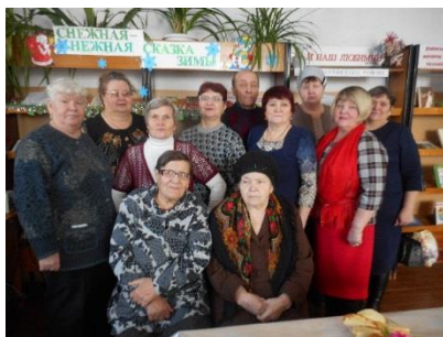
Традиционная народная культура. Клуб «Вдохновение». Народные посиделки