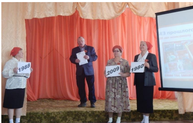
«Юность комсомольская моя»