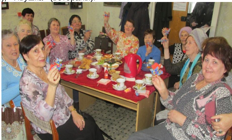
Заседание клуба «Берегиня»

Любительские объединения пожилых жителей, созданные при библиотеках, работают с разновозрастной аудиторией по самым различным направлениям: «Ветеран», «Берегиня», «У самовара», «Ивушка», «Березка», «Белая сирень», «Завалинка», «Собеседник», «Вдохновение», «Сибирячка» (досуг), «Золотая осень» (литературно-музыкальное направление), «Сударушка» (спорт), «Волшебный клубок», «Университет третьего возраста» (рукоделие), «Ивушка» (ветераны).