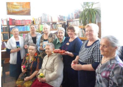
Клуб «Сударушка». Пасха

В сельских библиотеках работают клубы «Ветеран», «Сударушка», «Серпантин», «Собеседница», «Завалинка», «У самовара», «Пенсионерочка», «Золотой возраст» (досуг); «Истоки» (поэтический).