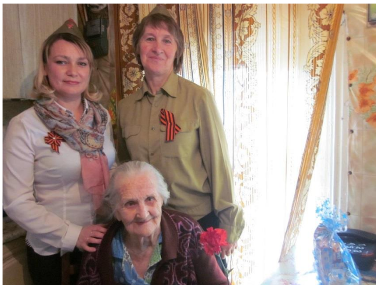
Поздравление ветеранов. Шелеповская сельская библиотека

Библиотеки МЦБС работали по программе «Я на пенсии сижу, время зря не провожу» .