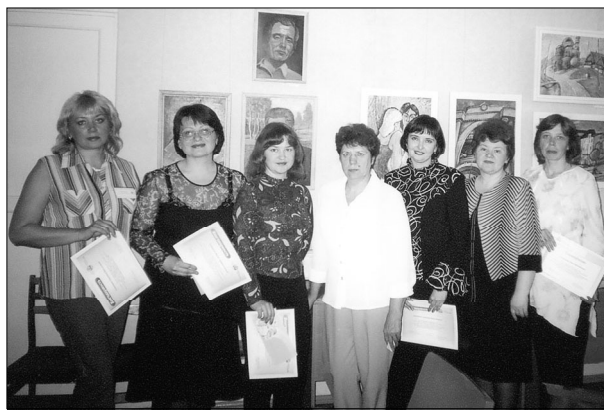
Участницы конкурса рефератов