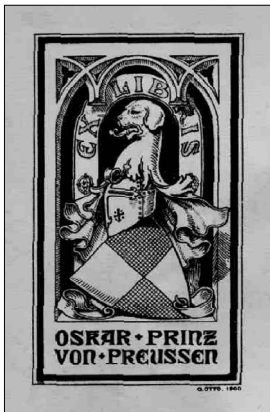
Из книг Оскара, принца Прусского

Еще более старинными книгами с экслибрисами располагает отдел литературы на иностранных языках.