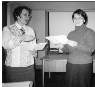
Вручение свидетельства об окончании курсов