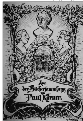
Из библиотечной коллекции Паула Корнера (предстоит установить персона)

интерес читающей публики. После летних каникул она продолжит свою работу. Надеемся, что итогом ее станет издание подробного каталога изданий с экслибрисами и владельческими штампами из фондов библиотеки.