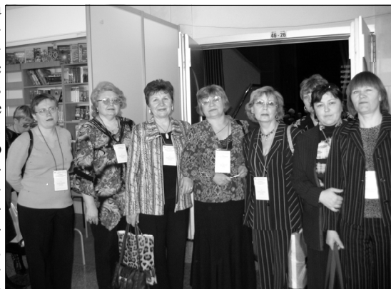
Участники XI конференции РБА Курганской области

А с утра - снова работа в секциях. Новое здание «Белинки» поражает простором помещений, ори-