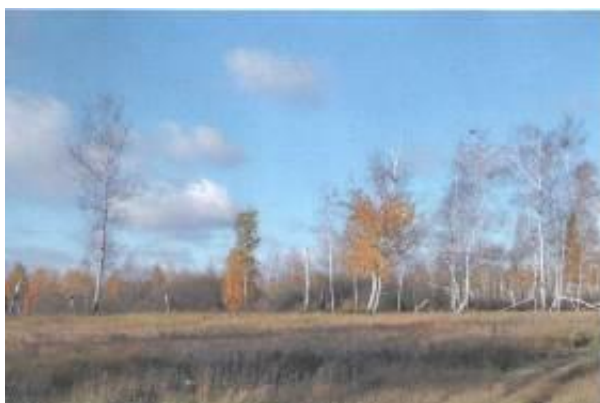
Западинное болото с кольцом ивняков среди лугово-степного ландшафта, заказник «Половинский»