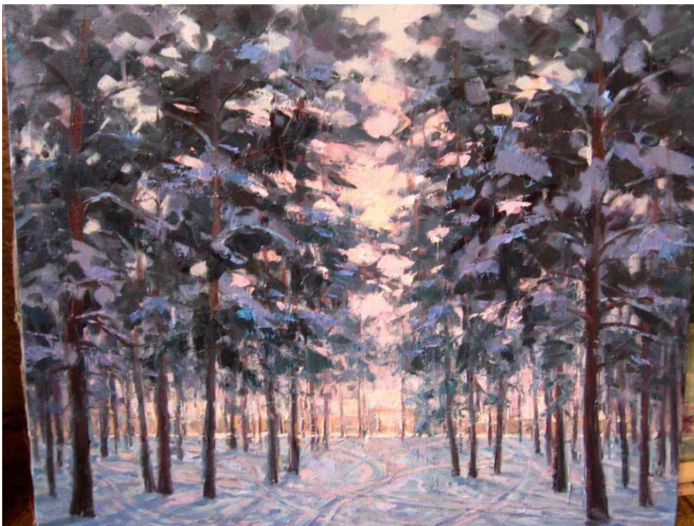
Садов А. В. «Зимнее солнце»