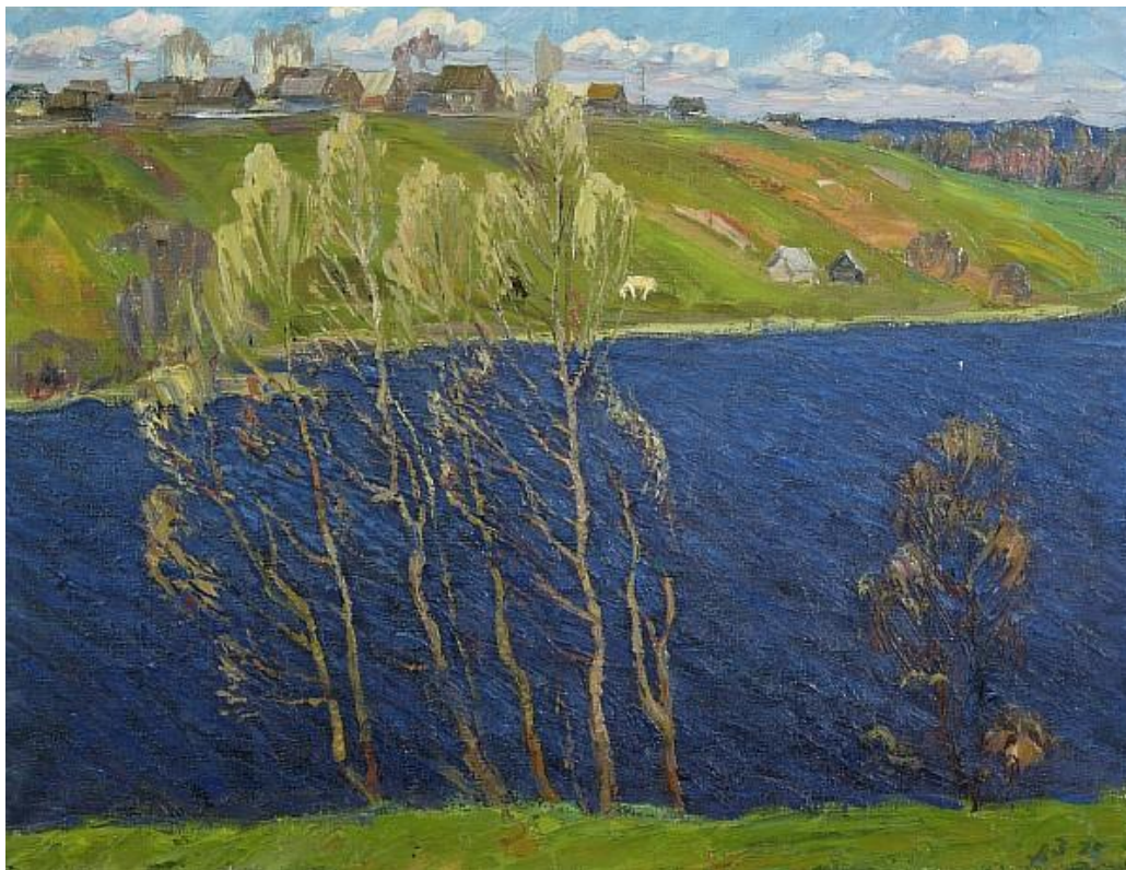
Абрамов А. А. «Академическая дача»