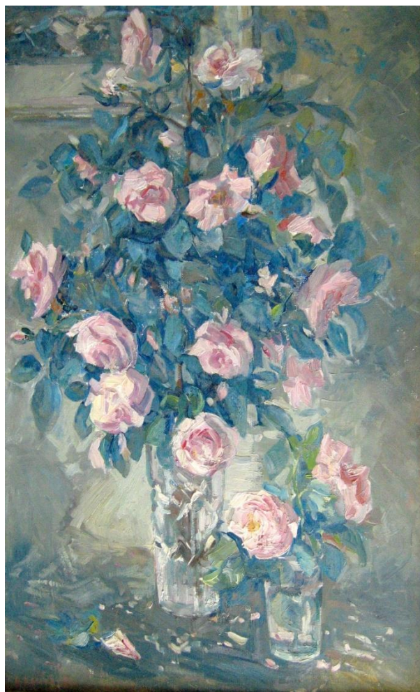
Колбин Б. М. «Розы»