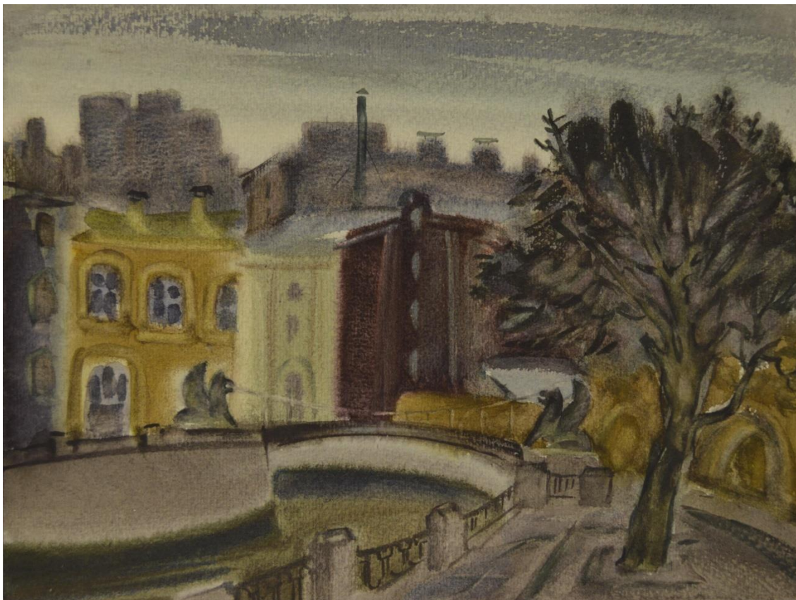
Хорошаев В. М. «Банковский мостик»