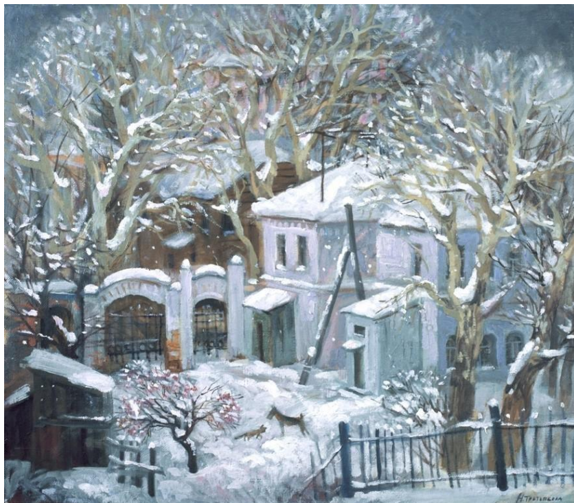
Третьякова-Баранова Н. П. «Зима. Курганские дворики»