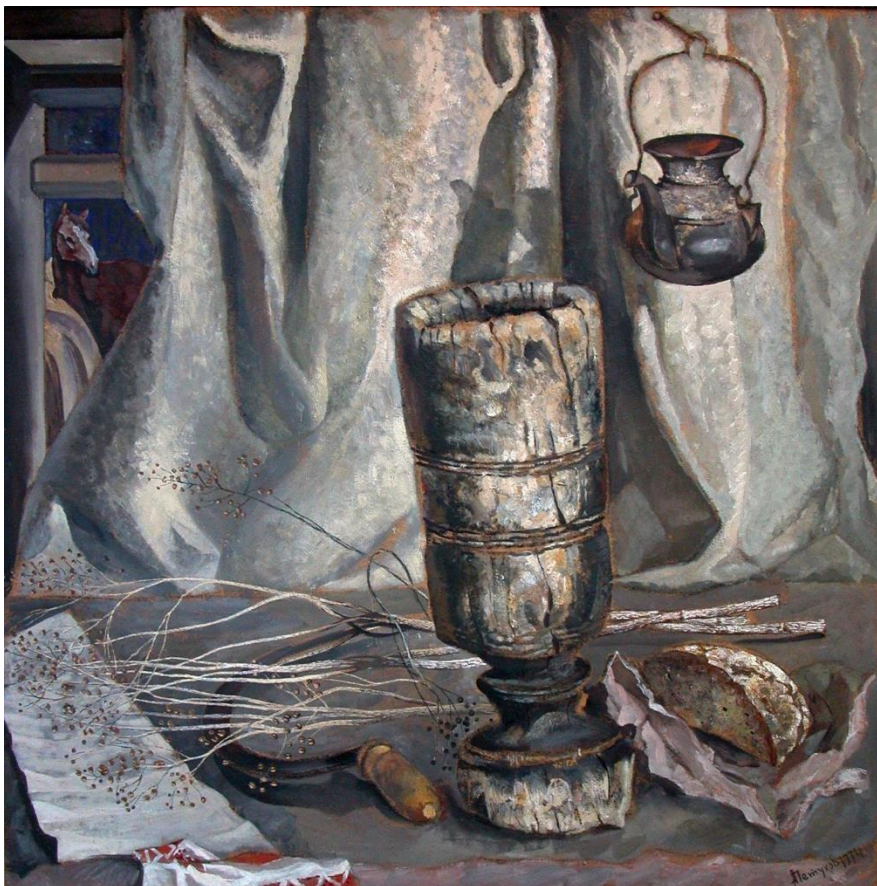
Петухов А. М. «Натюрморт со ступой»