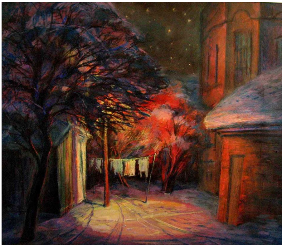
Садов А. В. «Ночной фонарь. Ул. Советская»