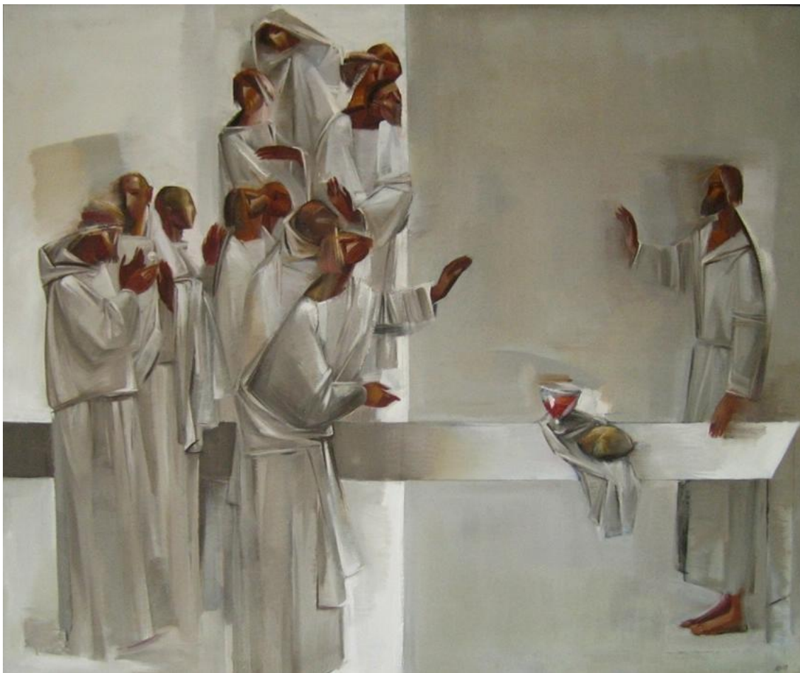
Кочарин А. Б. «Тайная вечеря»