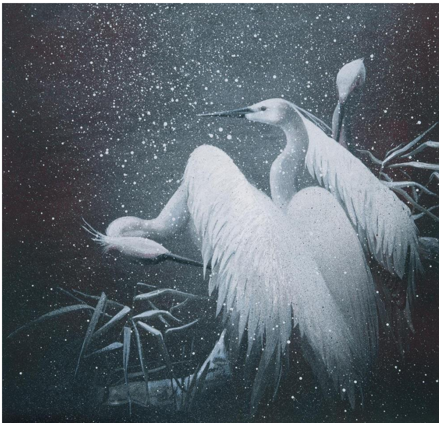
Меженова Т.В. «Птицы в снегу. Из серии “Восточные мотивы”»