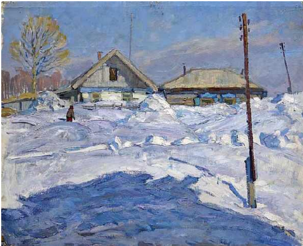
Абрамов А. А. «Мартовские тени»