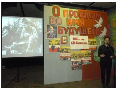
Литературный диалог к 100-летию К. Симонова «О прошлом во имя будущего»