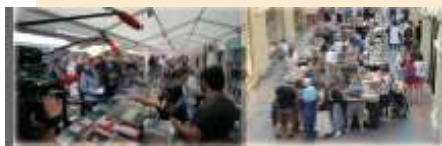
КНИЖНЫЙ ФЕСТИВАЛЬ «КРАСНАЯ ПЛОЩАДЬ»

С 11 по 14 июня в Москве прошел крупнейший в нашей стране книжный фестиваль. Организаторы выбрали для мероприятия Красную площадь и территорию вокруг нее. В этот раз в программу вошли не только выставки, но и лекции, мастер-классы, концерты, театральные постановки. В программу также вошли выступления артистов, музыкантов, поэтов, писателей. В этот раз в программу вошли не только выставки, но и лекции, мастер-классы, концерты, театральные постановки. В программу также вошли выступления артистов, музыкантов, поэтов, писателей.