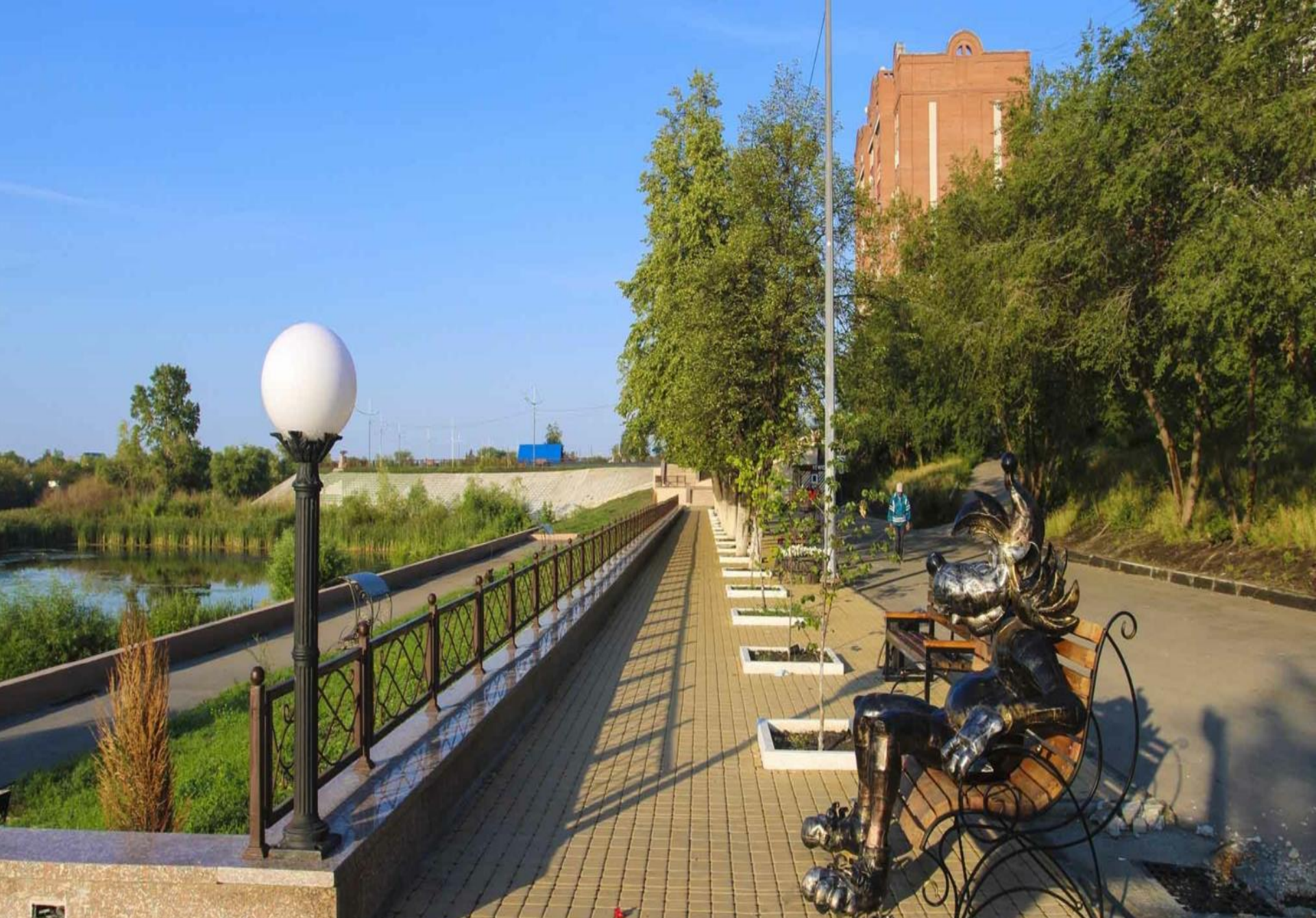
Die Promenade des Flusses Tobol