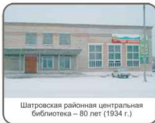
Шатровская районная центральная библиотека – 80 лет (1934 г.)