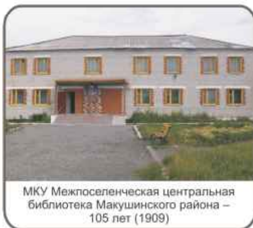
МКУ Межпоселенческая центральная библиотека Макушинского района – 105 лет (1909)