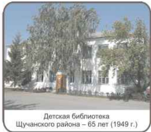
Детская библиотека Щучанского района – 65 лет (1949 г.)

14 – ШТРАУС (отец) ИОГАНН (1804-1849) – 210 лет со дня рождения. Австрийский скрипач, дирижер, композитор.