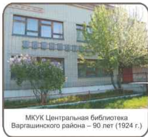
МКУК Центральная библиотека Варгашинского района – 90 лет (1924 г.)

1 – Праздник Весны и Труда (в России) . Ранее – Международный день солидарности трудящихся . День международной солидарности трудящихся установлен конгрессом II Интернационала (Париж, 14-21 июля 1889 г.) в память о выступлении рабочих в Чикаго и других городах США, организовавших 1 мая 1886 г. забастовку с требованием 8-часового рабочего дня и демонстрацию, закончившуюся кровопролитным столкновением с полицией.