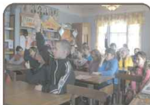
Детская библиотека – структурное подразделение МКУК «ЦРБ» Куртамышского района – 70 лет (1944 г.)

1 – Международный день птиц. В 1906 году в этот день подписана Международная конвенция об охране птиц. Впервые День птиц был проведен в 1924 году под руководством учителя Мазурова в Ермолинской школе Смоленской области. Считается, что этот юннатский праздник в СССР утвердился в 1926 году.