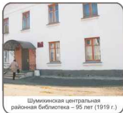
Шумихинская центральная районная библиотека – 95 лет (1919 г.)

11 – ШТРАУС, РИХАРД (1864-1949) – 150 лет со дня рождения. Немецкий композитор. Творчество, наполненное жизнелюбием и красотой.