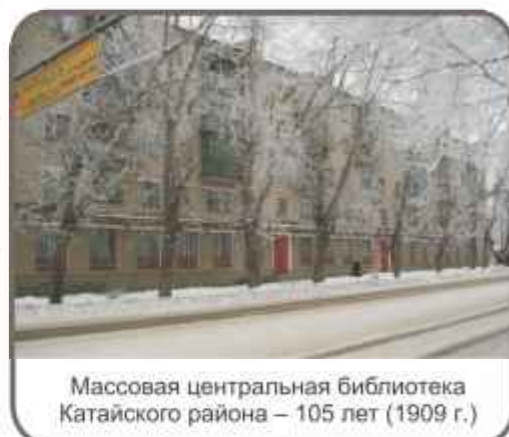
Массовая центральная библиотека Катайского района – 105 лет (1909 г.)