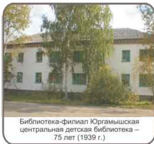
Библиотека-филиал Юргамышская центральная детская библиотека – 75 лет (1939 г.)