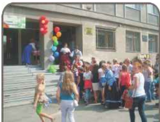
Центральная детская библиотека им. Н.Островского – 80 лет (1934 г.)