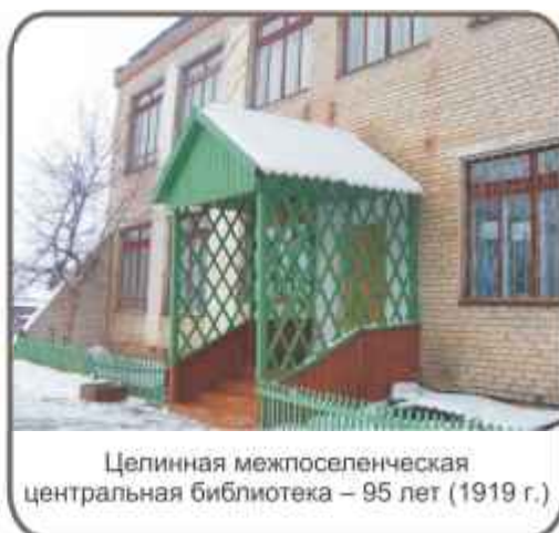
Целинная межпоселенческая центральная библиотека – 95 лет (1919 г.)