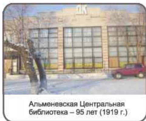
Альменовская Центральная библиотека – 95 лет (1919 г.)

14 – День святого Валентина. День всех влюбленных. Католический праздник.