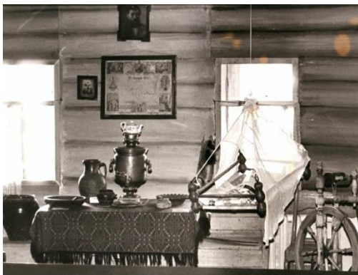
Часть экспозиции зала. Крестьянский быт Мишкинского музея