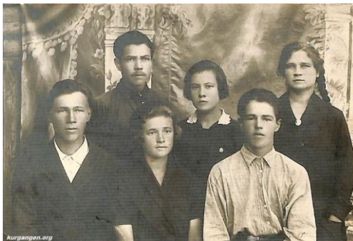
Группа ликвидации безграмотности (ликбез). С. Утятское. 1928 год.