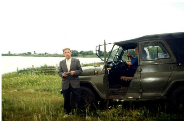
Сбор экспонатов для музея. д. Быдино