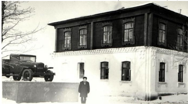
В напряжённые дни организации музея

замечательных тружениках Мишкинского района и просто каждодневных интересных событий. Его жизнь оборвалась трагически в возрасте 55 лет. В 2020 году ему исполнилось бы 70. Это и стало своеобразным толчком к данной работе: вспомнить основные вехи жизненного пути человека, отдавшего всю свою сознательную жизнь делу краеведения.