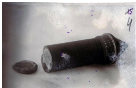
Рис. 2. Зарядный стакан 82-мм осколочной мины после контрольных испытаний на Уральском артиллерийском полигоне в г. Нижний Тагил. 1943 г.

В 1941 г. завод начинает перестраиваться для производства военной продукции. Однако ещё