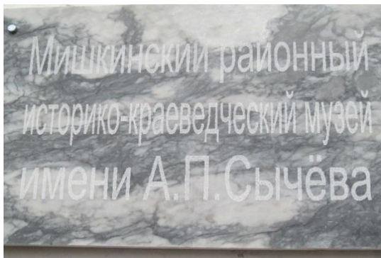
Мемориальная доска на фасаде музея