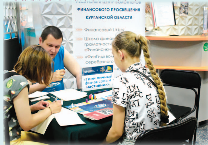
Финансовая игра на «Библионочи» в «Юговке»

где оперативно размещаются новости и анонсы.