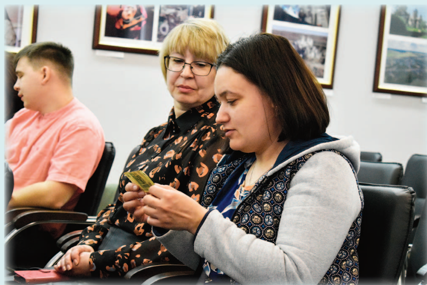
Мастер-класс о том, как распознать испорченную купюру

Р есурсный центр работает на постоянной основе. Здесь реализуются проекты «FinClub PROфинансы» для молодёжи, «ФинГид» – занятия для волонтеров серебряного возраста, Школа финансовой грамотности «Финансики» для детей младшего школьного возраста. А также – клуб «Твой финансовый наставник», где проходят занятия и лекции для людей среднего возраста. В Центре рассказывают, как научиться правильно вести свой бюджет и по-