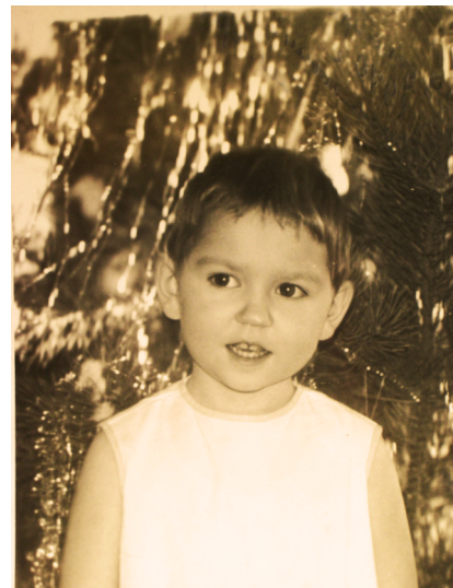
Первое выступление на новогоднем празднике