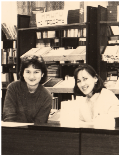
Годы работы на абонементе