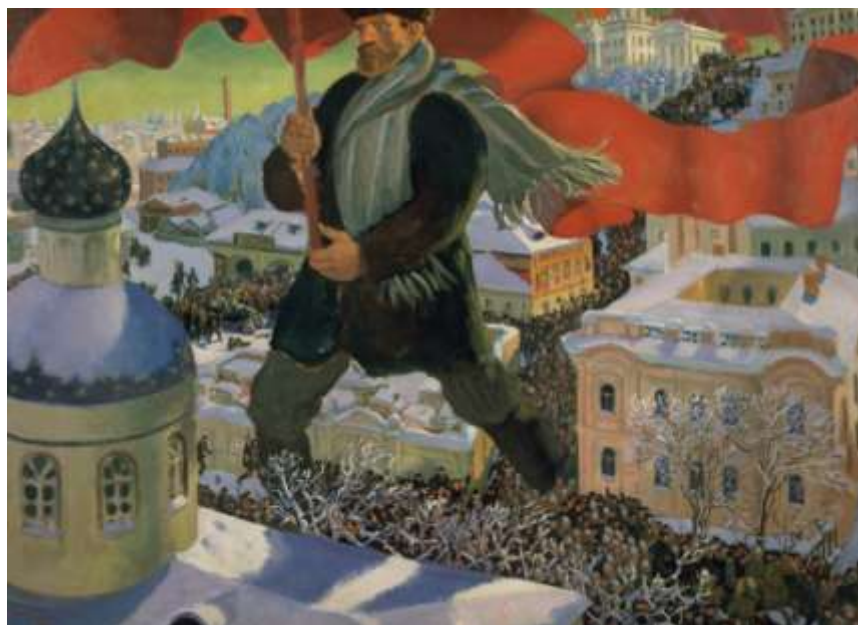
Б. Кустодиев. Большевик, 1920 г.