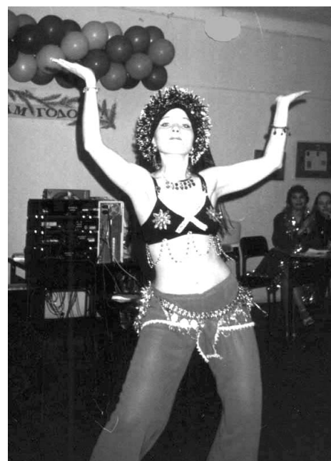
“Гостя из Марокко”

В нашей библиотеке к празднику готовились заранее. Целую неделю отделы библиотеки «сверкали» и удивляли читателей красочными поздравительными газетами, разнообразными елками, резными, воздушными снежинками.