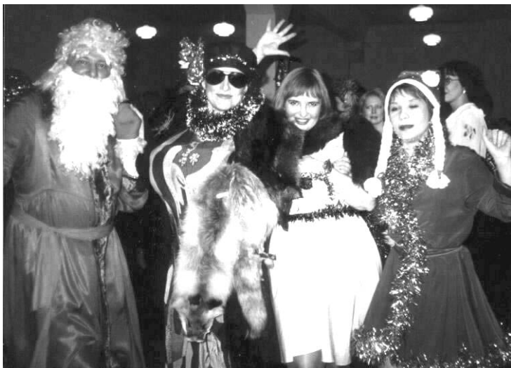
“Все будет ХА-РА-ШО!”

Праздник удался! Все получили призы и подарки. Положительные эмоции переполняли - все веселились, шутили, танцевали от души. И очень хотелось бы, чтобы зажигательная энергия новогодних праздников весь год откликалась в ваших сердцах. А чувство ожидания новогоднего чуда - не исчезло.