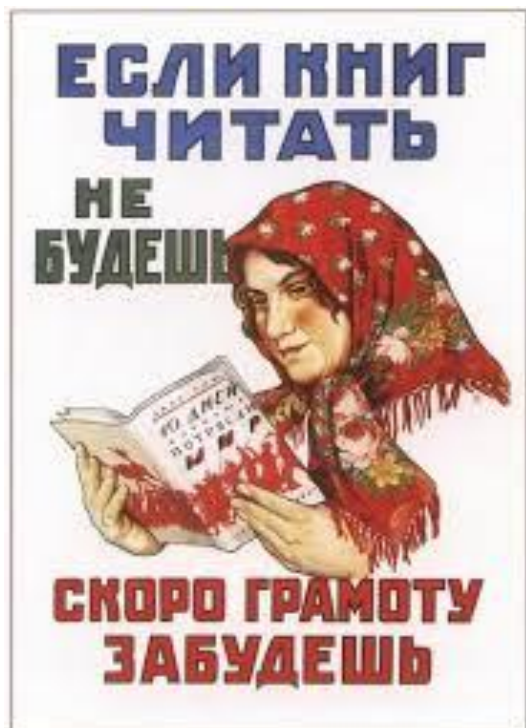
ТТ. Могилевской А. Если книг читать не будешь — скоро грамоту забудешь. 1925