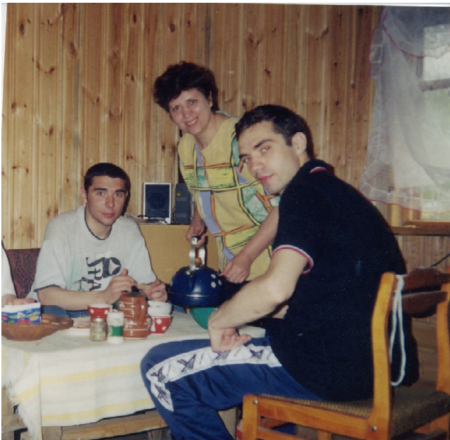
Живу ими, дышу ими...