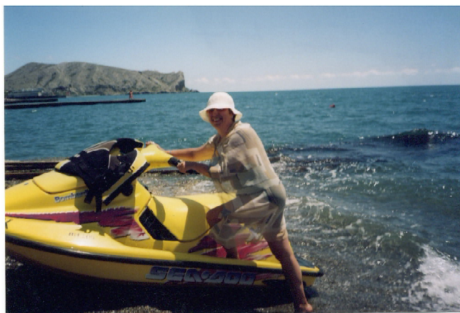
Лучше гор может быть, только море...