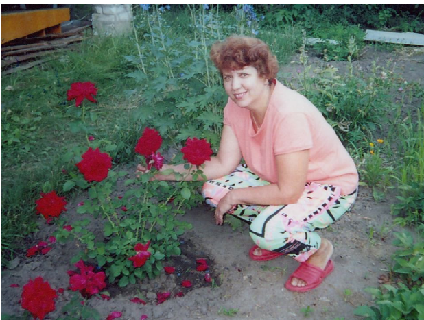
Сама садик я садила...